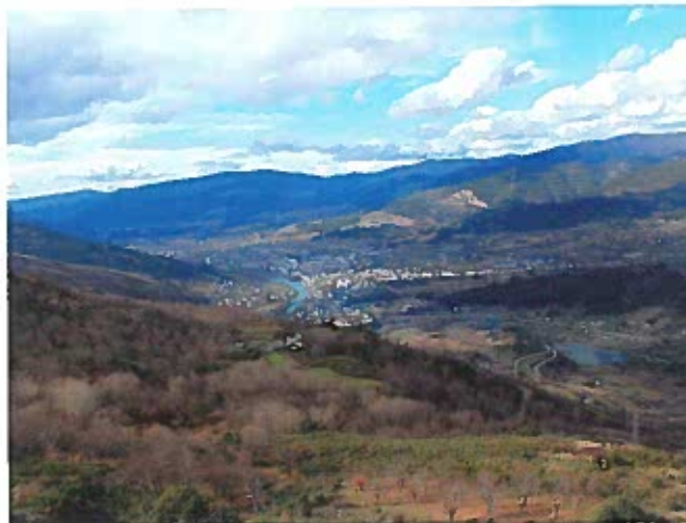
Vista de O Barco desde Alixo

derecha, donde se encuentra el lavadero para posteriormente coger la segunda calle a la izquierda y llegar hasta las antiguas escuelas.