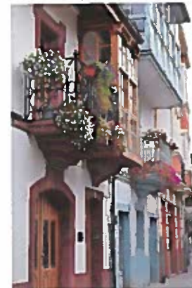
Casco Viejo (O Barco)

dicha población hay una pasarela peatonal de madera por encima de la margen izquierda del río Sil, que enlaza con Viloiira. Continuando todo recto, y tras cruzar el puente sobre el río y tomar la primera calle a la izquierda se desciende por la calle Real, arteria central del Casco Viejo barquense, donde se encuentran algunas casas señoriales tradicionales con escudos en sus fachadas. Y, si el recorrido se hace en la época adecuada, con sus balcones repletos de flores de diferentes colores. De ahí, seguimos hasta llegar al paseo del Malecón, nuestro punto de partida.