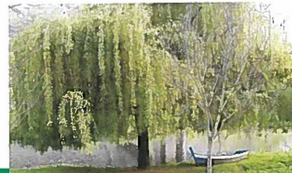
Paseo del Malecón (O Barco)