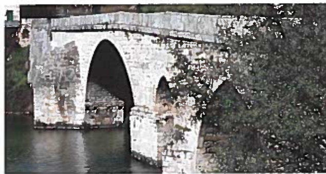
Puente de A Cigarrosa

Se continúa luego por la calle Ponte hasta la plaza del Doctor Quiroga, donde se encuentran algunas de las casas más antiguas de la población. Se