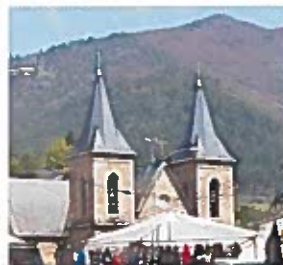
Iglesia Ntra. Sra. de Fátima

La ruta continúa todo recto por una zona llana, paralela a la vía del tren y al río, hasta llegar a la presa de Santiago en Valencia do Sil. Dejando dicha población, se asciende hasta un cruce en el que se toma el camino de la izquierda, y luego la OU-536 en dirección A Rúa.