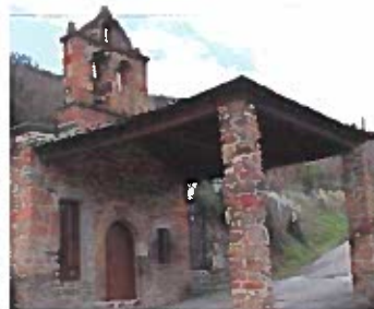
Iglesia en Penouta

sigue por la travesía Carballeda, la calle Sobredo y la Travesía Castofolla hasta llegar a la carretera OUR-195 en dirección Santa María / Outeiro / Barxela / San Paio.