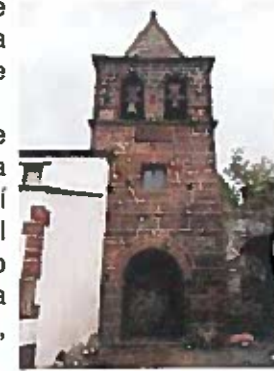
Iglesia de Correxais

Todo recto, se continúa en dirección a Arnado para desde allí realizar, pero a la inversa, el mismo recorrido del inicio de la ruta hasta regresar a la Plaza de Otero Pedrayo, en Viloira.