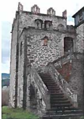
Castillo de Torre Penelas

En esta localidad se encuentra el castillo de Torre Penelas, edificado en el siglo XIX y, tras pasar por debajo del arco de una de sus torres, se continúa todo recto hasta salir de Arnado por una zona de viñedos. Siguiendo la carretera, a la derecha se accede a un puente sobre el río Sil que cruzaremos y, después, giraremos a la izquierda, para continuar todo recto por la margen derecha del