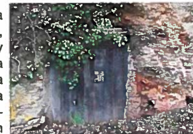
"Covas" en Arnado y Penouta

sigue por la travesía Carballeda, la calle Sobredo y la Travesía Castofolla hasta llegar a la carretera OUR-195 en dirección Santa María / Outeiro / Barxela / San Paio.