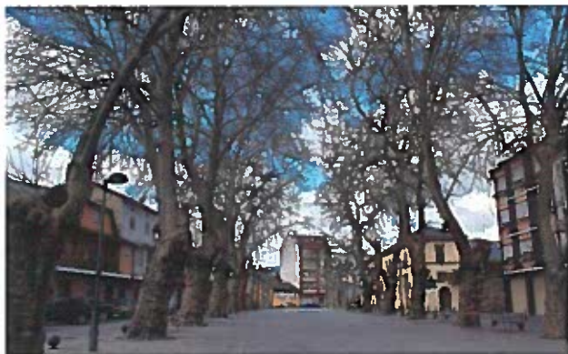
Plaza de Otero Pedrayo

Se trata de la ruta más grande de todas las propuestas por el Ayuntamiento de O Barco, y permite conocer los atractivos del río Sil en la comarca de Valdeorras, recorriendo los municipios de O Barco, Vilamartín, A Rúa y Petín. El punto de inicio y llegada es la Plaza de Otero Pedrayo, en Viloira. Tras salir por las calles Igrexa y Villabril, es necesario seguir las señales en dirección a "Polígono Industrial/Área recreativa de O Salgueiral". La carretera se bifurca en dos puntos y, en ambos casos, será necesario tomar a la izquierda. Tras pasar por